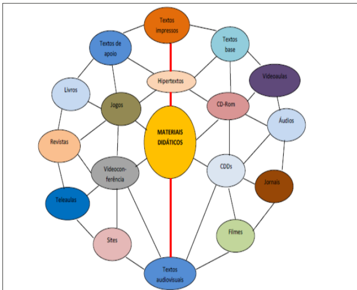
Figura 1: Caráter complementar entre os materiais didáticos